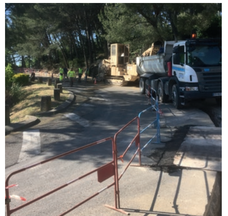
Enfouissement moyenne tention - Virage camping