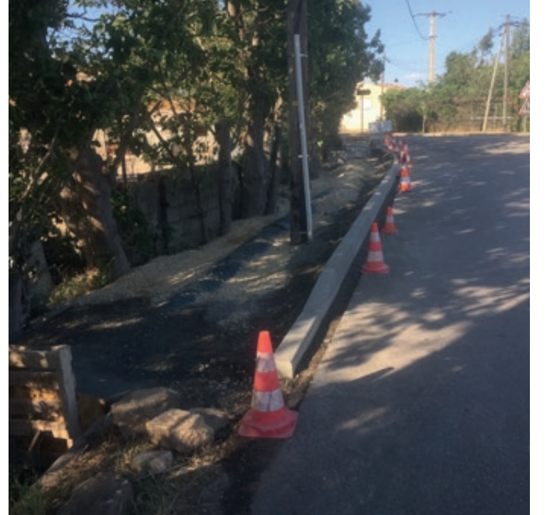
Trottoir chemin Cave Coopérative