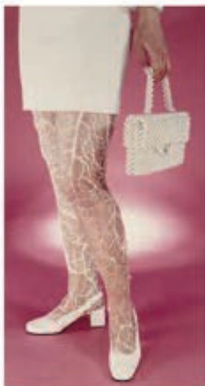
Natscha Lesueur. Sans titre. 1997, photographie contrecollée sur aluminium recouverte par un film plastique ultra brillant, 150 x 90 cm. © Adagp, Paris, 2019. Collection Frac Provence- Alpes-Côte d'Azur.

Cependant, l'objet ne disparaît jamais complètement de l'œuvre, et permet une surimpression de sens. L'objet n'est en aucun cas une matière neutre et grâce à sa dimension populaire et urbaine, il crée un univers accessible au plus grand nombre. La société de consommation, la prolifération des objets, leur aspect jetable, ainsi que la perte d'aura fascinent les artistes et transfigurent les objets qui font alors entrer le quotidien dans la sphère artistique. Par l'objet, le réel devient le matériau et le support de l'œuvre. L'objet réserve donc une place paradoxale au geste de l'artiste : décontextualisée, débarrassée des traditions et des techniques mais finalement toujours ancrée dans une matérialité (nouvelle). Matière améliorée, matériau commun ou hommage au quotidien, l'objet sort de son contexte et modifie sa fonction afin de transformer le banal en art / ou d'inscrire l'art dans une banalité retrouvée.