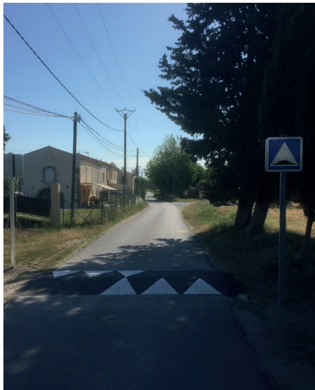
Ralentisseur chemin Cave Coopérative