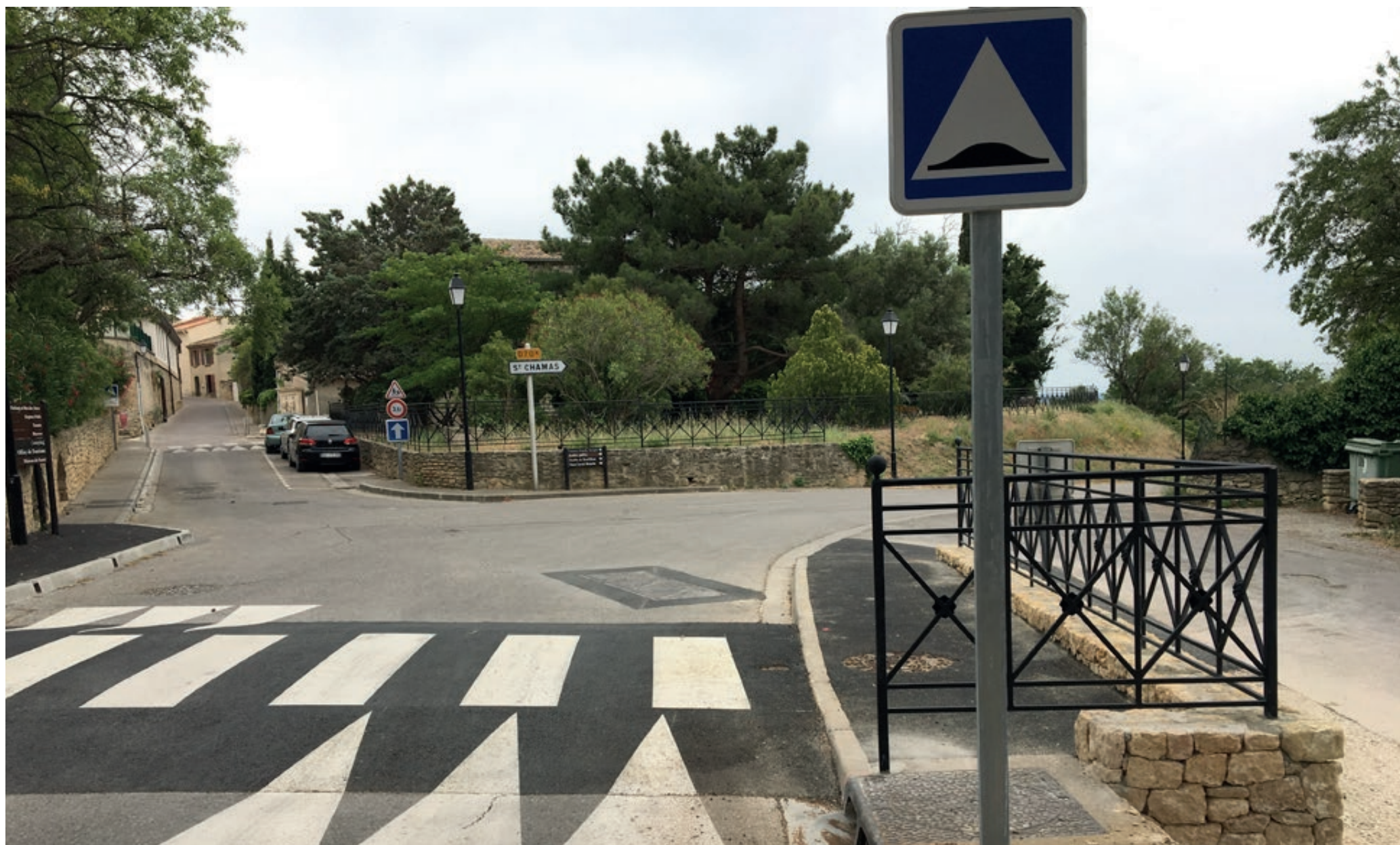
Passage piéton pour les écoliers