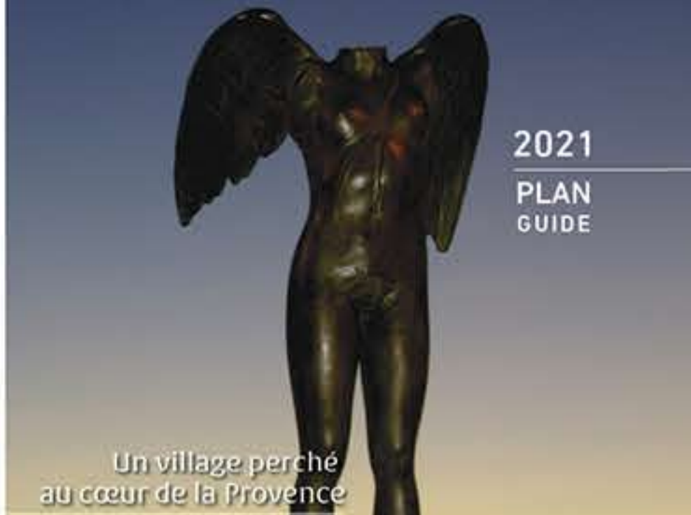
Un village perché au cœur de la Provence