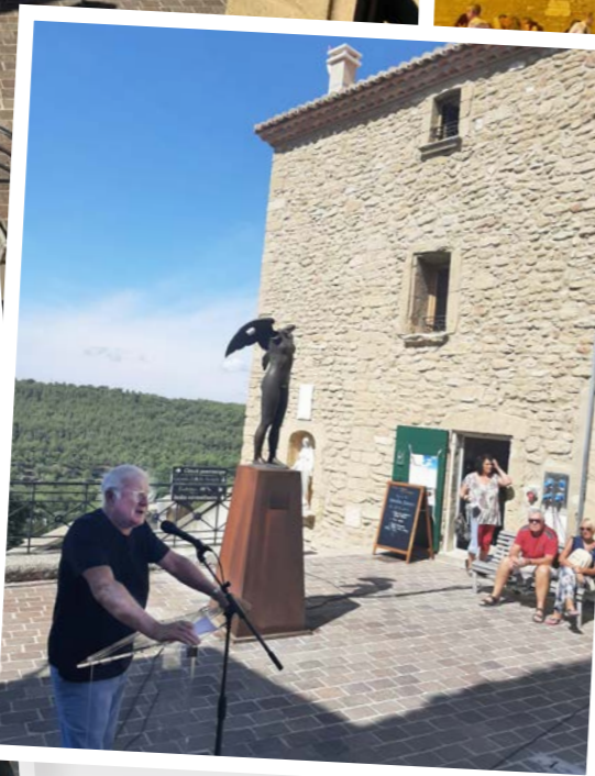
Journée des associations